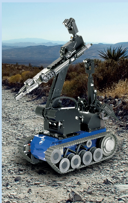
De producten van Faulhaber worden onder meer toegepast in een draaiplatform panoramacamera ondergebracht in een onbemand manipulatorvoertuig.