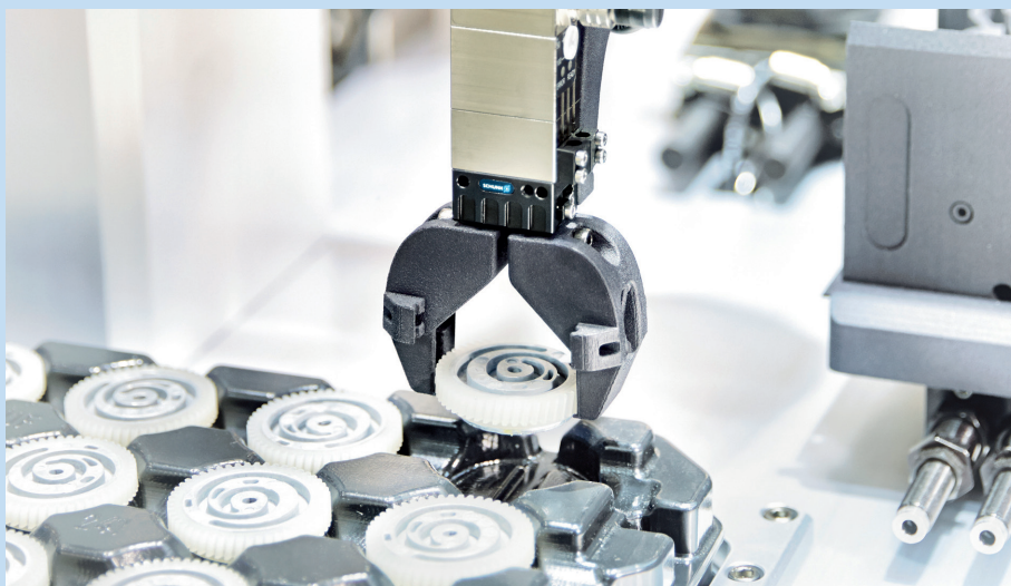
Faulhaber systemen zijn eenvoudig aan te sluiten en te configureren in geautomatiseerde productiesystemen.

Omdat het bedrijf met de nieuwe organisatiestructuur letterlijk dichterbij de klant staat, zijn er meer mogelijkheden beschikbaar om direct bij en met klanten ideeën uit te wisselen. Dit biedt voor beide partijen voordelen; vooral wanneer het gaat om het modificeren van producten, nieuwe ontwikkelingen en klantspecifieke producten of applicatiesoftware. Voor een snelle uitwisseling van gedetailleerde informatie is het bovendien mogelijk de klant